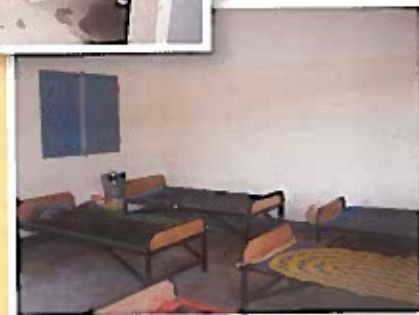
Lavanderia e dormitorio secondo i costumi del luogo