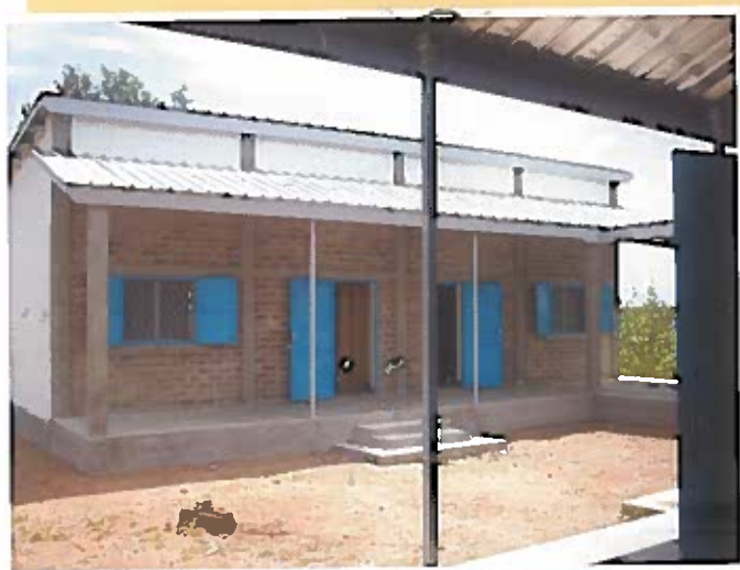
Costruzione esterna del nuovo Foyer

Abbiamo già costruito la struttura esterna completa, in mattoni crudi fatti a mano, tetto di legno con copertura di ondulina. Essa comprenderà all'interno una sala notte, una sala studio, una cucina, servizi con docce. L'intero edificio dovrà essere completato nelle rifiniture. Gli interni dovranno essere arredati con tavoli e sedie, armadi e quanto occorre per attrezzare la cucina. Avrà un arredamento essenziale ma che garantirà alle ragazze un'accoglienza dignitosa e familiare. Per lo studio occorreranno libri, quaderni e tutto il necessario per andare a scuola. A tutto questo dobbiamo aggiungere i costi delle tasse scolastiche e delle spese di sostentamento. È un sogno che non costa poco, ma è realizzabile se a muoverci sarà il desiderio di donare un po' di noi per far nascere la gioia nel cuore di chi aspetta una possibilità di vita migliore.